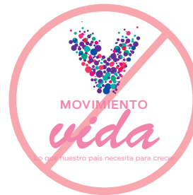
No cambiar su tipografía