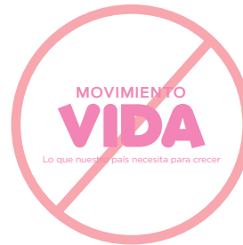
No usar sin el isotipo