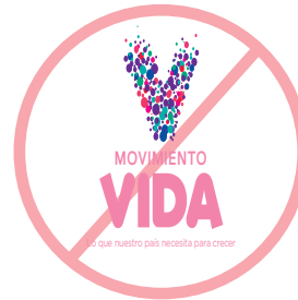
No deformar el logo

Para preservar la integridad de la marca Movimiento VIDA, por favor asegúrese de aplicar el logotipo correctamente. No redibuje el logotipo de ninguna manera ya que puede alterarse o distorsionarse dando lugar a aplicaciones incorrectas. Algunos usos incorrectos se muestran aquí.