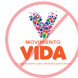
No usar con otros colores