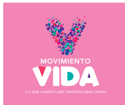
Sobre rosado (principal)

Uso de color para imprimir en policromía.