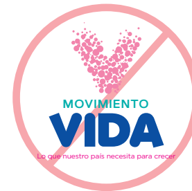
No invertir los colores